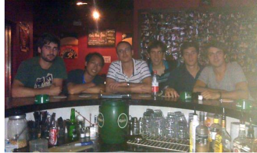
Verre(s) au Beaver Bar