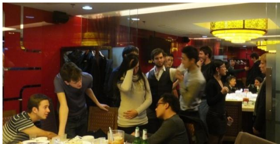
Repas du 3 décembre

Pour conclure, 2012 a donc été une année constructive pour le GCC à Pékin. Sous l'impulsion de nos camarades de Shanghai, les bases sont maintenant bien en place et c'est donc confiant que le GCC Pékin s'apprête à relever les nombreux défis qui l'attendent en 2013 !