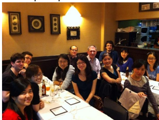
Dîner de la St Médard au restaurant l'Indochine

le GCC in Paris publie une lettre (presque) mensuelle, revenant sur les événements centralo-chinois de la capitale, et parfois d'ailleurs (p.ex. cet été: course de bateaux-dragons à Zhengzhou).