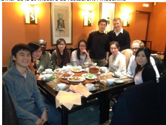
Dîner de la St Nicolas au Bistrot de Pékin