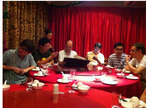
Dîner au Baoluo

Aujourd'hui, avec tous ces évènements organisés, le groupe de Shanghai souhaite redoubler d'effort en organisant encore plus d'évènements, mais aussi en mettant l'accent sur l'adhésion des jeunes diplômés chinois dont ceux de Centrale Pékin qui, à terme, devraient représenter la majorité des membres du GCC. Pour cela, nous allons développer la communication vers ce groupe émergent à travers notamment un système de parrainage comme ce qui existe déjà dans nos écoles françaises.