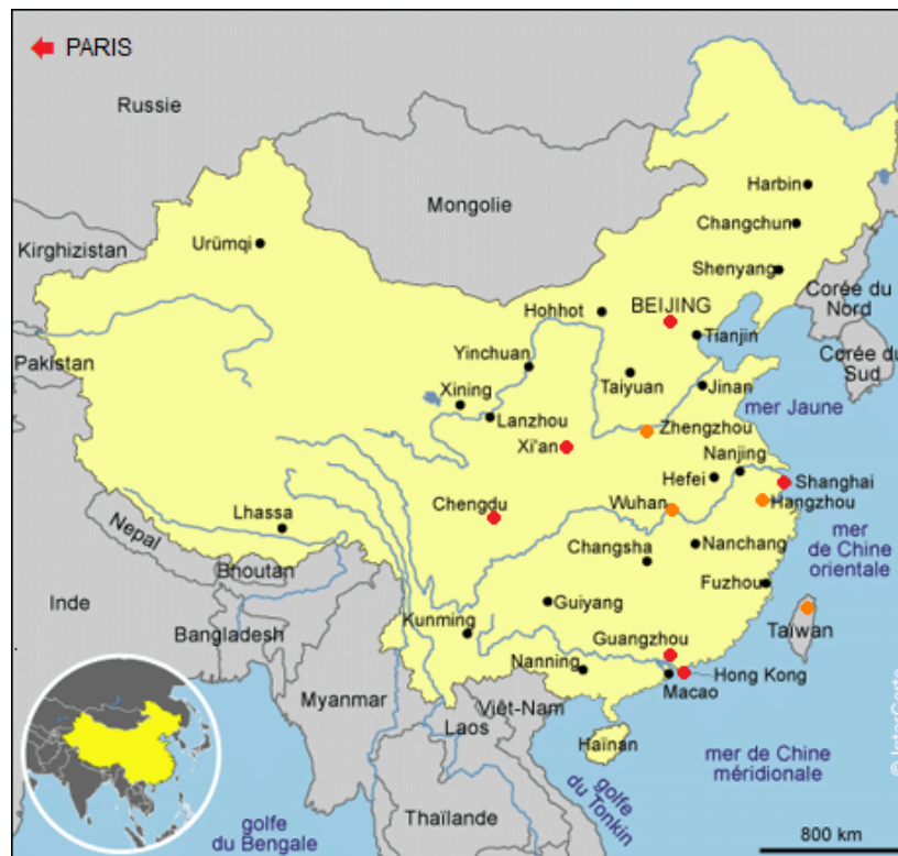
● Présence d'une branche du GCC active en 2012 ● Présence d'un (ou de) correspondant(s) du GCC