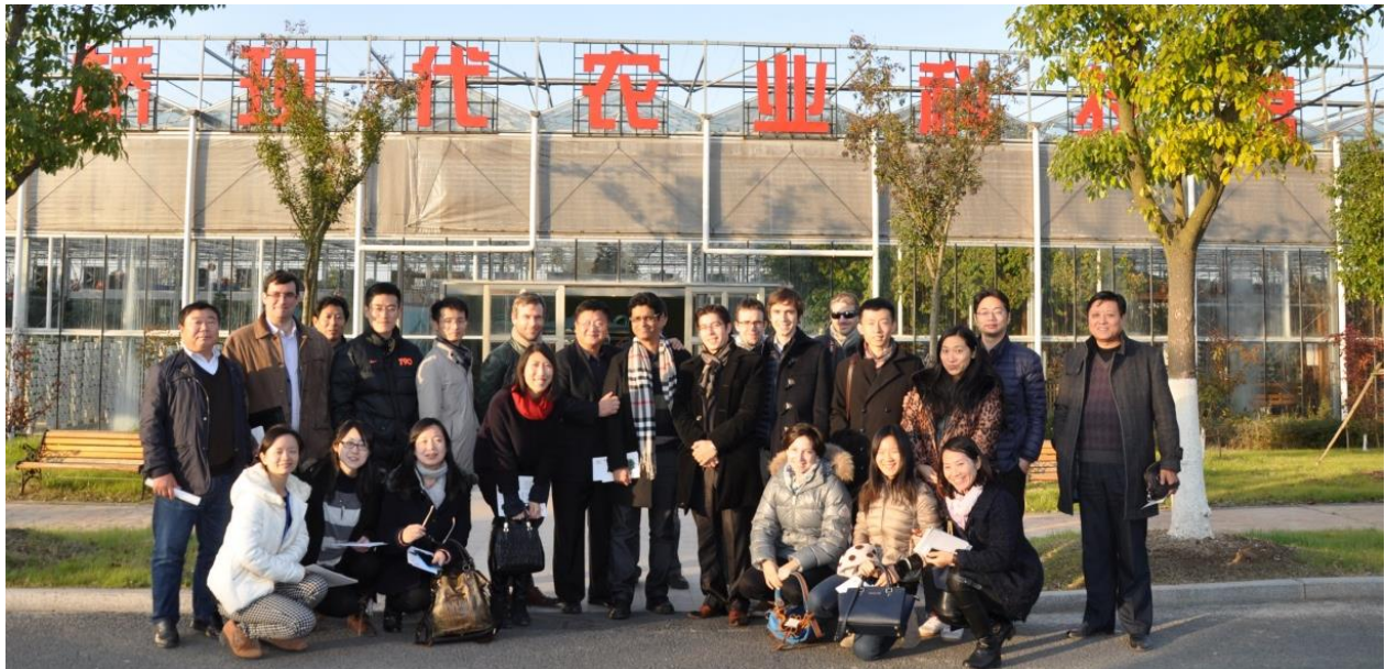
Participants à l'évènement

Dafeng est une ville en plein développement. En 2016 le train à grande vitesse va rapprocher Dafeng et Shanghai d'une étape insignifiante — en 45min nous arriverons à Dafeng depuis la gare de Hongqiao. La vie est très peu chère par rapport à Shanghai. Cela peut s'illustrer avec le prix de l'immobilier : à Shanghai, le prix moyen est 40,000 CNY/m 2 et à Dafeng, dans le quartier le plus luxueux (Shakespeare village), ça coûte seulement 3,000 CNY/m 2 . De mon point de vue, la ville a un grand potentiel et c'est le moment d'investir.