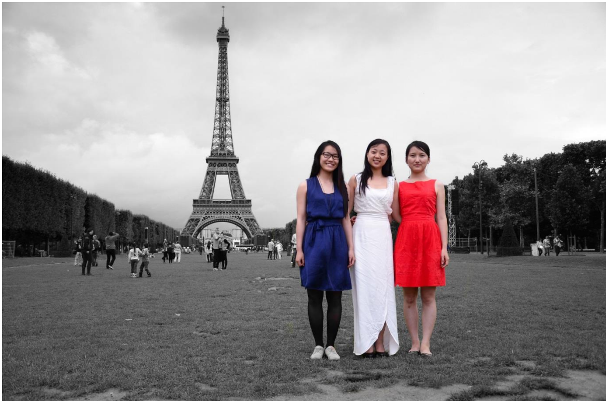
Etudiante des Ecole Centrale de Lille (cf page suivante)