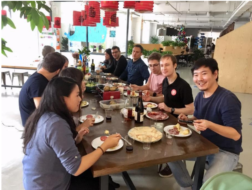
Decembre St Nicolas