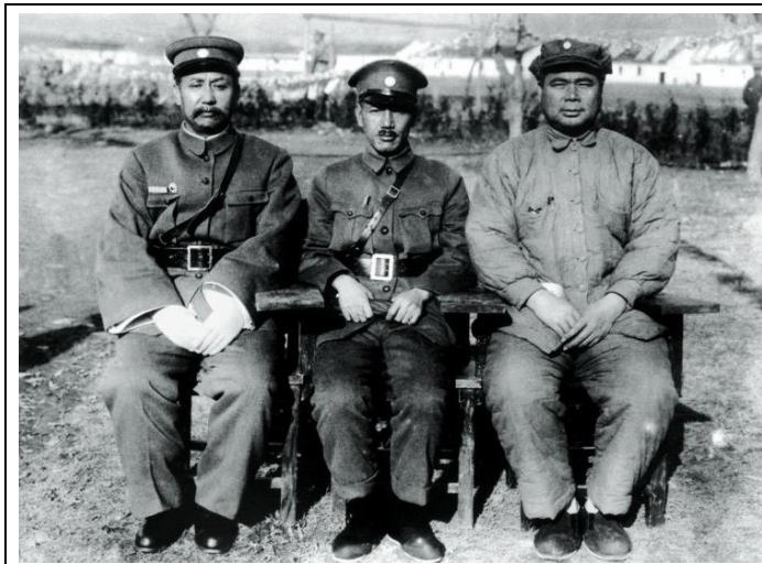
Les généraux Yan, Chiang et Feng

En 1926, le KMT – désormais sous la direction du Général Chiang Kai-shek depuis la mort du Dr Sun en 1925 – lance "l'expédition du Nord" afin de réunifier le pays et se débarrasser des cliques du Nord engagées dans d'incessantes guerres. Le chantier du Lung-hai est de nouveau interrompu.