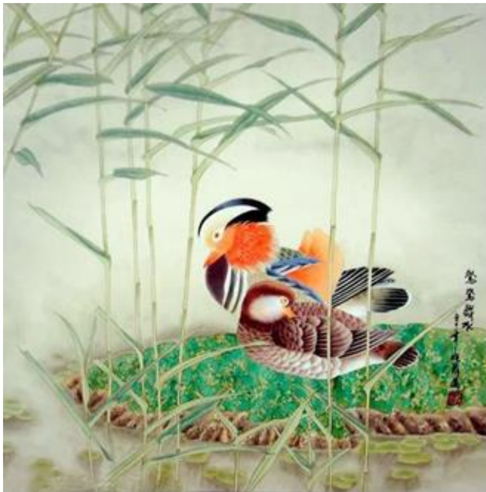
La peinture chinoise de Canard Mandarin