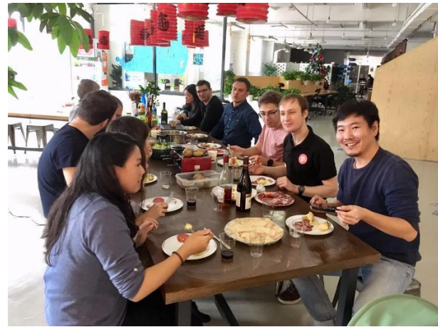
Juin Premier Ministre