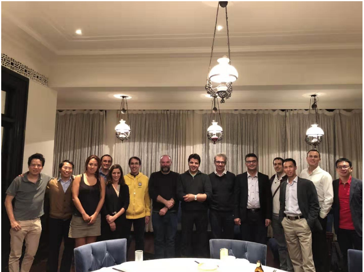
Diner de la veille avec les délégués