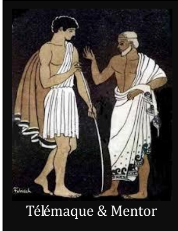
Télémaque & Mentor

Le Mentoring a une part essentielle au sein du groupe GCC, afin de maintenir des liens forts entre jeunes professionnels et ingénieurs centraliens expérimentés. Comptant mettre à profit cette richesse, l'équipe du