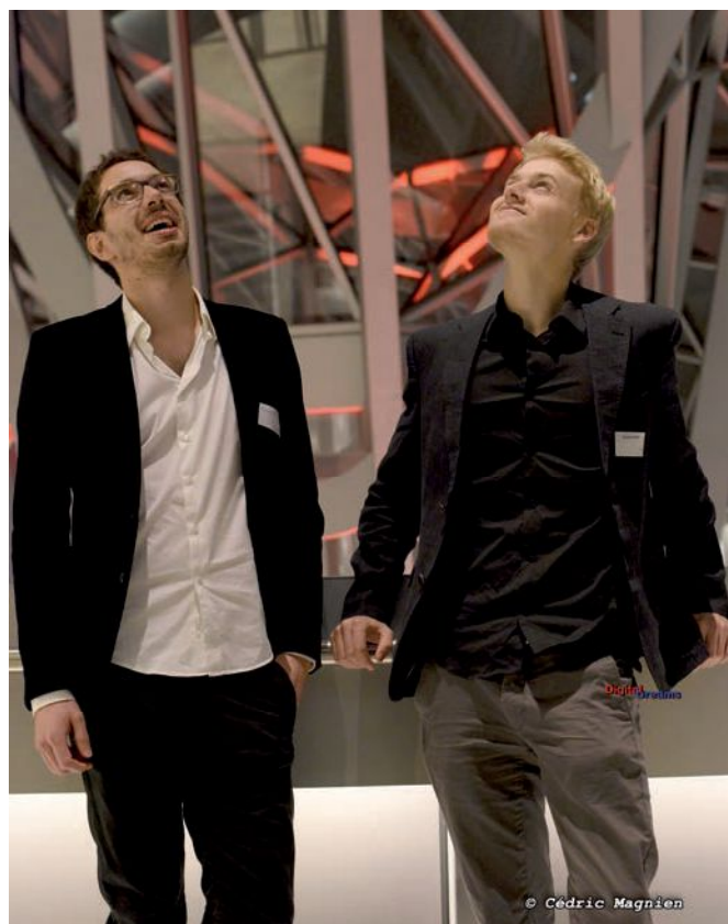
Lors des 150 ans de l'ACL au musée des Confluences

Dans les premières années qui suivent l'École, tout s'enchaîne très vite. L'ACL est là pour m'accompagner dans mon nouveau poste, ma nouvelle région, en jouant sans attendre la carte du réseau centralien.