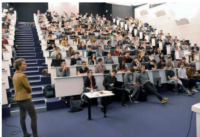
Atelier « Le réseau c'est pas pipeau »

Des ateliers et rencontres carrières me sont également régulièrement proposés tout au long de l'année, avec des apports théoriques, des mises en situation et beaucoup d'échanges. Ces séances m'éclairent et m'aident à formaliser mon projet professionnel.