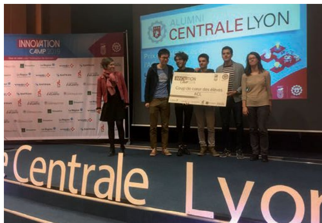
Soirée « L'Ingénieur Entrepreneur »