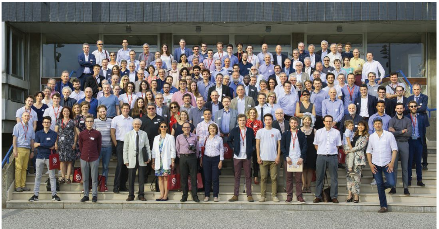
Photo 50 ans 50 promos - 2 juin 2018 à Écully