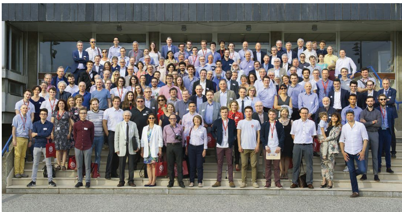
Photo 50 ans 50 promos - 2 juin 2018 à Écully